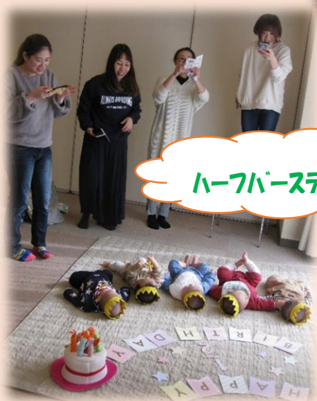
ハーフバースデー